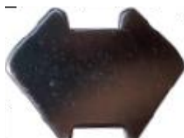
Chave AX4 cód: 001804