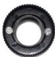
Chave AX1 cód: 000736