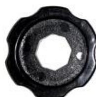
Chave AX2 cód: 000737